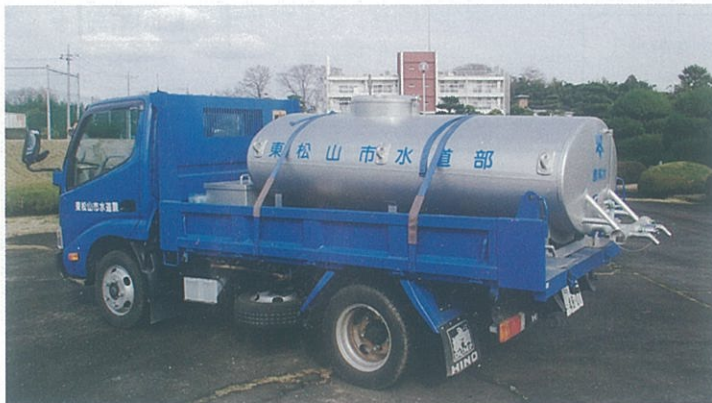
東松山市の給水車両